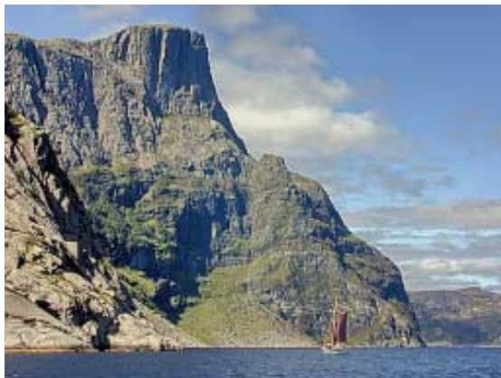
Hornelen i Bremanger, sjøklippa der Olav den heilage nedkjempa trolla

«Simplere, vi kan gjerne sige plumpere, gaar den same Tanke i Visen om Hellige Oluf og Trolde. Fortællingen, med sine Trolde, der forsternes paa Heltekongens Bud, er halvvejs en Helgenlegende, halvvejs en gentagelse af nordiske Oldsagn, der lader Helten narre Trolde, saa de overraskes af Solen og forsternes. Dens Trolde skildring afviger fra de andre danske Viser og maa skyldes den norske Folkehumor».