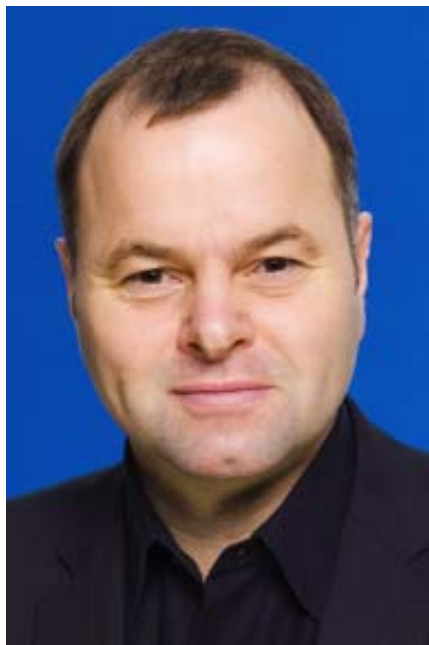
Vil du gje stemma di til denne mannen?