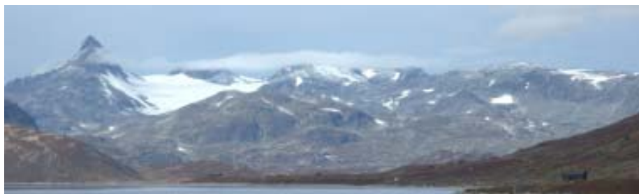
Haut i Jotunheimen

Alice Gudheim, produsent Sol av Isfolket