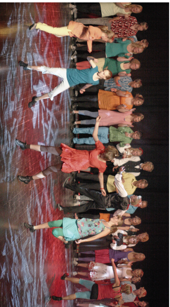
Her er det mange unge, spreke dansarar som er i full sving på Jørn Hiline-stemnet 2010