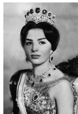
Farah Diba: Sjå kor vakker ho er.