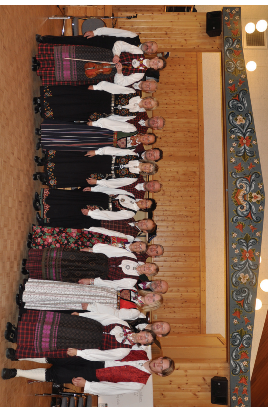
Heile den norske gjengen.

hestar med delakarar frå Europa, Sør-Amerika og Nord-Amerika, ein årleg seanse i september. Store hallar med salsboder, matboder av ulike slag og tusenvis menneske prega området. Ein spesiell plass for oss valdrisar, og programmet vart vel motteke.